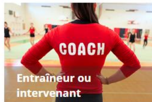
Entraîneur ou intervenant