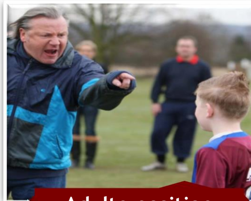
Adulte position d'autorité